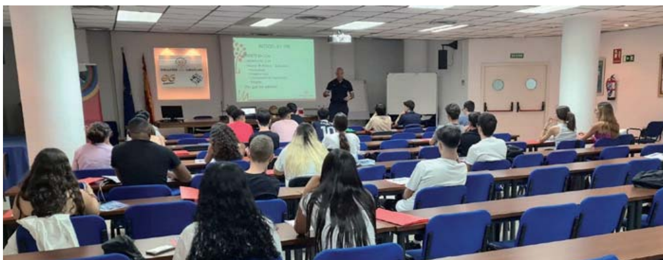
⊕ Los nuevos aspirantes participan en la formación impartida por el Departamento de Deporte Escolar y Valores de ECM

Por un lado, destacan la juventud como factor a tener en cuenta en el futuro, pues la profesión parece asegurada. Que los jóvenes se interesen por el arbitraje significa que hay cantera y que los chicos y las chicas que el 4 de noviembre arbitren sus primeros encuentros pueden ser los árbitros de las grandes ligas el día de mañana. Pero por otro, señalan este factor con cautela, pues como ya hemos dicho, el aprendizaje es común entre jugadores, delegados y técnicos y puntualizan que todas las partes implicadas en la competición deberán tener paciencia con los nuevos árbitros.