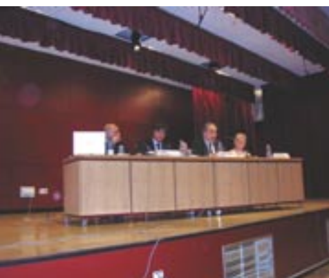
Asamblea Ordinaria celebrada en el Colegio Divina Pastora de Madrid.

Desde su experiencia como profesor expresó, asimismo, algunas reflexiones sobre el fracaso escolar, el aprendizaje como juego, la educación no competitiva, el idioma o la igualdad, llegando a la conclusión de que la calidad de la escuela en la edad obligatoria es "muy deficiente".