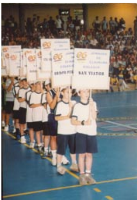
La jornada de clausura tendrá lugar en el Colegio Sagrada Familia como en temporadas anteriores.