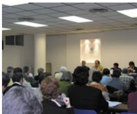
Asambleas Generales de FERE-CECA y EyG Madrid celebrada en la sede de las organizaciones.