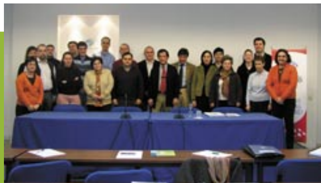
Participantes en el curso de especialista posan tras una de las jornadas de trabajo celebrada en la sede de FERE-CECA y EyG.

Engarzado y en paralelo con este curso se ha puesto en marcha también un ciclo de "Economía y Educación" con conferencias pronunciadas por econo-