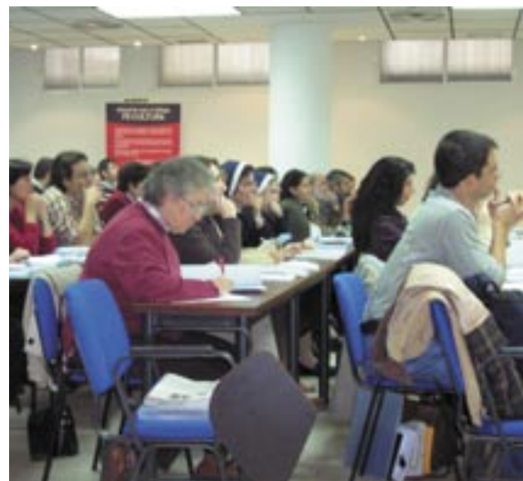
Un momento de la jornada sobre convivencia del 16 de noviembre.