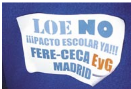
Pegatina elaborada por FERE-CECA y EyG Madrid, dentro de la campaña de sensibilización.

Cabe destacar que, en materia de LOE, las ESCUELAS CATÓLICAS DE MADRID han estado en primera línea apoyando a las organizaciones estatales en la negociación y toma de decisiones, e implicándose en las mismas. Sin duda, el esfuerzo realizado por nuestras organizaciones madrileñas, por las instituciones titulares, por sus centros y sus equipos directivos, ha sido crucial en el éxito de la manifestación del 12 de noviembre y en los frutos recogidos, a los que nos hemos referido en el editorial del presente número. La sociedad que opta por nuestros centros está dispuesta a implicarse y defender sus derechos. Ésta sí que es una buena noticia. ¡Gracias, y enhorabuena a todos!