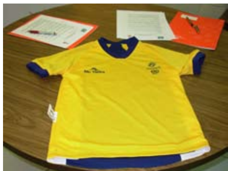
Esta temporada las camisetas son reversibles en colores azul marino y amarillo.

Ante tal número de participantes es fácil comprender que existi-