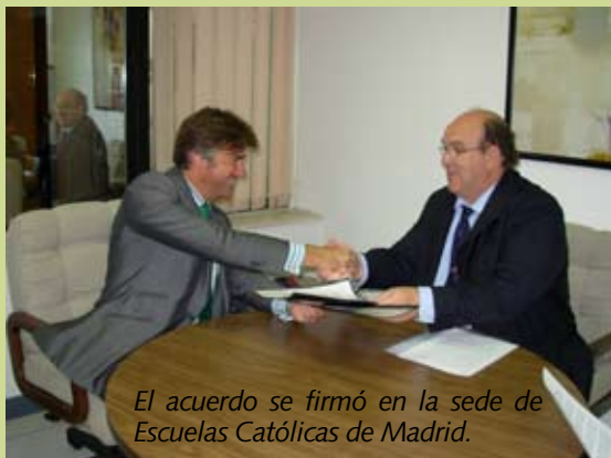
El acuerdo se firmó en la sede de Escuelas Católicas de Madrid.

La FER se compromete así a impartir un curso gratuito de 20 horas de formación a los profesores de los centros participantes; a dotar del material audiovisual y del pack para jugar Rugby Cinta a cada colegio; a responder las posibles consultas o dudas que puedan tener los profesores durante el desarrollo de la Unidad Didáctica; y a posibilitar la participación de los alumnos de dichos colegios en la competición final con la que se cerrará el proyecto autonómico.