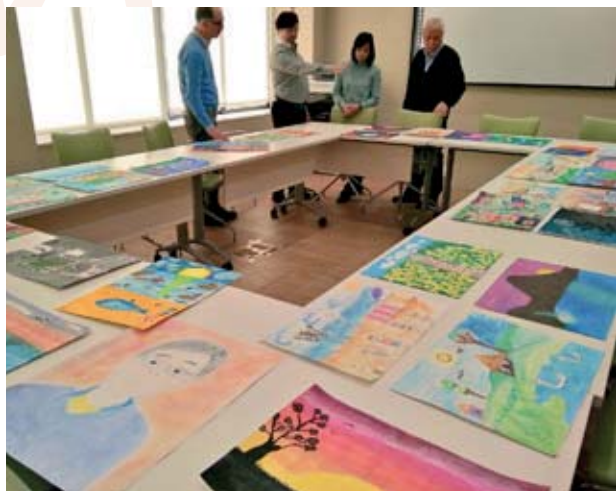
⊕ Selección de dibujos de la III Edición del Concurso Internacional de Pintura y Dibujo Infantil de la Fundación Moa