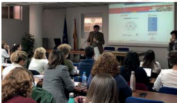
⊕ Reunión de coordinadores BEDA