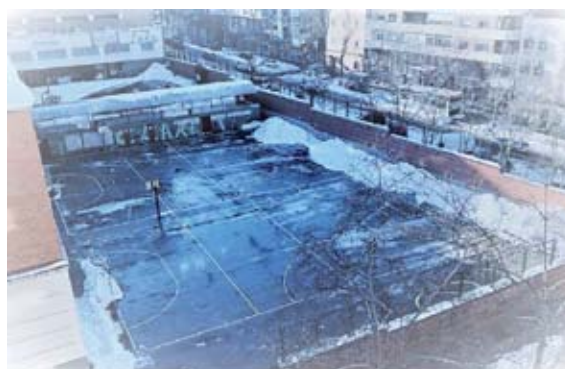
⊕ Filomena llegó con fuerza e inhabilitó los patios de los colegios, en la imagen el Claret

Eso es así en gran parte debido a que la Consejería de Salud no permite, como en el caso de los federados, que los jugadores de los equipos del deporte escolar se desplacen a o desde zonas básicas de salud confinadas con libertad para disputar sus encuentros, teniendo que ser estos suspendidos y reprogramados cuando el colegio anfitrión o el visitante sale de la restricción de movilidad impuesta por las autoridades.