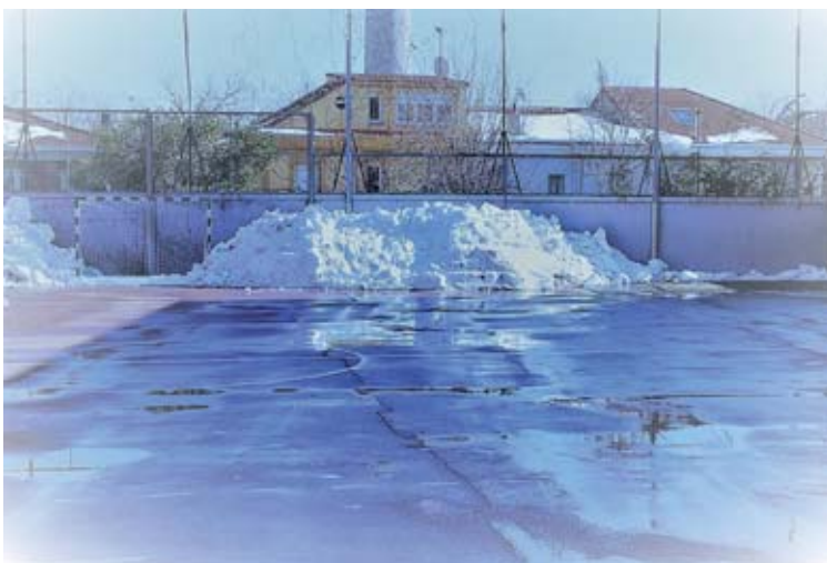
⊕ Santa Ana y San Rafael también quedó inhabilitado por la nieve

Antes de concluir, debo recalcar lo que ha supuesto y está suponiendo el virus para muchos sectores productivos, pero muy en especial para el de las actividades deportivas. Este ha sido olvidado por las distintas instituciones públicas, desde las sanitarias, pasando por las deportivas y llegando a las educativas, las cuales no se han pronunciado ni han normativizado para que dicho sector disponga de igualdad de tratamiento en el marco escolar, federado o municipal, así como para que reciba el apoyo que otros ámbitos productivos también perjudicados sí están recibiendo.