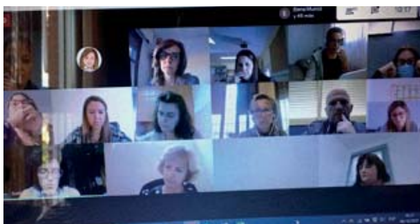
⊕ Jornada de formación online para nuevos Coordinadores BEDA