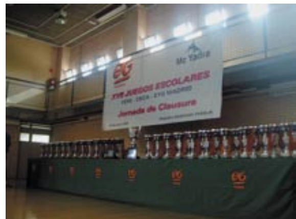
La Jornada de Clausura de los XVIII Juegos Escolares FERE-CECA y EyG de Madrid tendrá lugar el 9 de junio.

Tras los infantiles llegarán los cadetes, del 21 al 26 de junio, con los siguientes participantes: Ntra. Sra. Ángeles (futsal masculino); Ntra. Sra. del Pilar (vóley femenino); Ntra. Sra. Providencia (baloncesto masculino); Virgen de Atocha (futsal masculino y baloncesto femenino); Sta. M a Pilar (fútbol 11); Calasancio (baloncesto femenino y futsal masculino); Amor de Dios (baloncesto femenino); Pureza de María (baloncesto femenino); Obispo Perelló (baloncesto masculino); Claret (baloncesto masculino); Santo Domingo Savio (voleibol femeni-