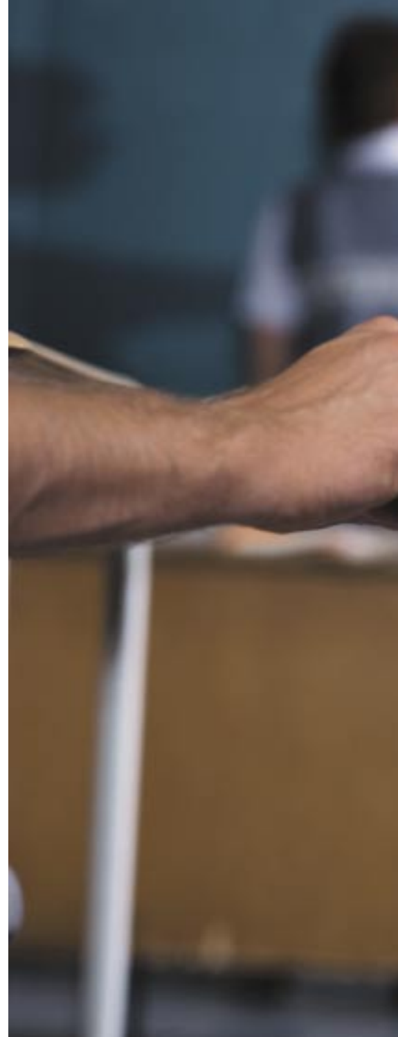
En 1º de Bachillerato el alumno con dos suspensos promociona a 2º.

En materia de evaluación del Bachillerato, la LOE establece en su artículo 36.2 que "los alumnos promocionarán de primero a segundo de Bachillerato cuando hayan superado las materias cursadas o tengan evaluación negativa en dos materias pendientes, como máximo". El concepto de "promoción" implica, al menos en la normativa en vigor, que el alumno se matricula de todas las asignaturas del curso al que promociona. La posibilidad de matricularse en asignaturas de cursos diferentes queda circunscrita, según la LOE, a los supuestos de promoción a 2º de Bachillerato (completo) con una o